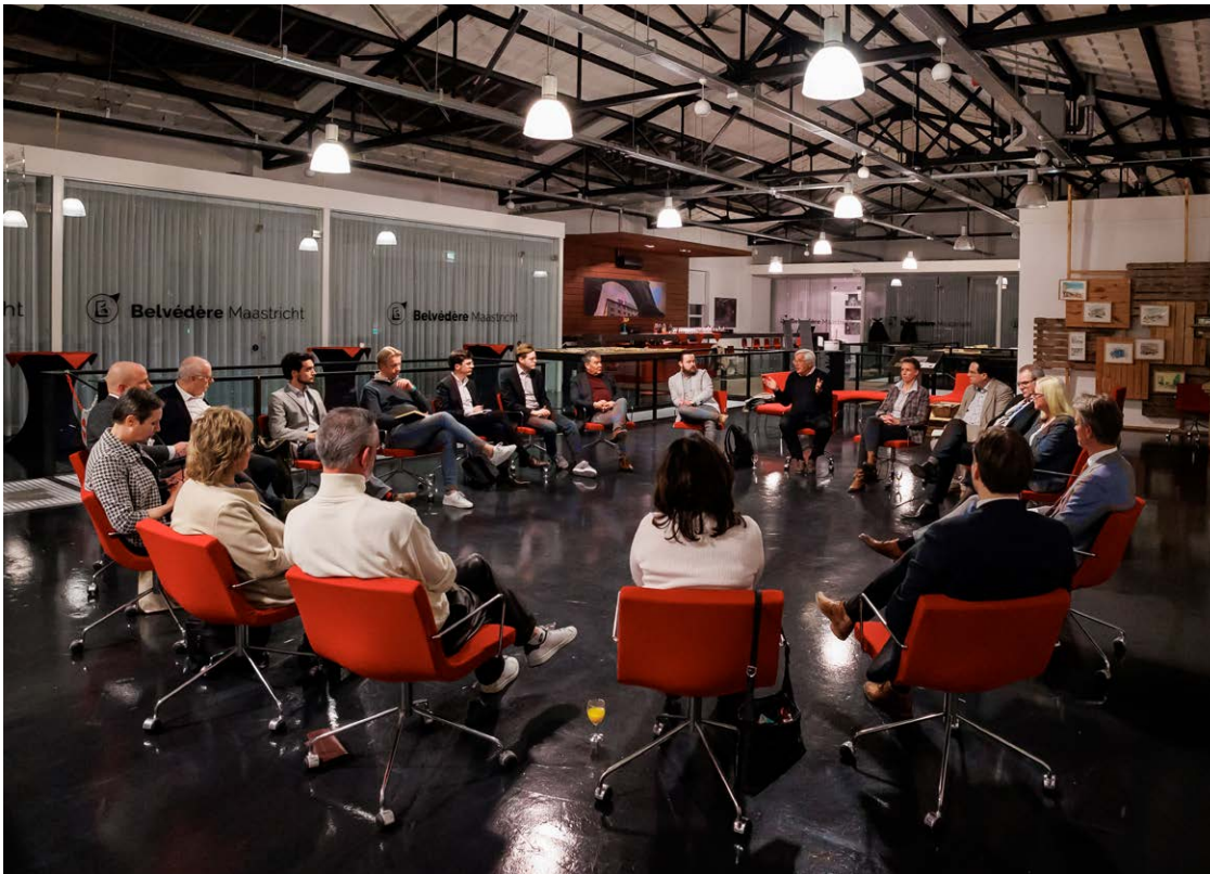
Startbijeenkomst informatiefase in de Fenikshof, donderdag 24 maart

Vanuit deze opgave adviseren wij verder om in de volgende fase niet vanuit traditioneel coalitie-oppositie-denken een coalitieprogramma voor de periode 2022-2026 op te stellen, ook geen raadsprogramma, maar te gaan bouwen aan een stadsprogramma met breed draagvlak binnen raad én stad. Het proces om tot zo'n stadsprogramma te komen zien wij als een eerste lakmoesproef van het daadwerkelijk anders gaan werken aan de inhoudelijke opgaven van de stad. Een stevige gebiedsgerichte werkwijze vanuit stadsbestuur én gemeentelijke organisatie achten we daarbij noodzakelijk om de verbinding naar wijken en buurten te herstellen.