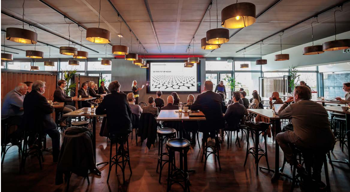
Informateurs geven tussenstand in Businessclub MVV, donderdag 7 april