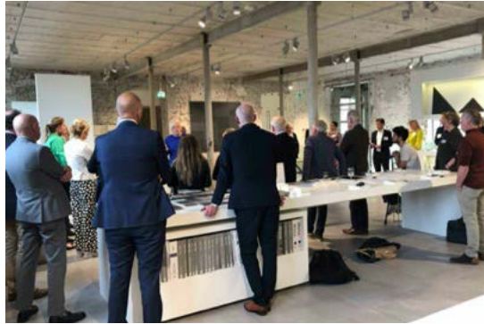
Partnerorganisaties formuleren adviezen in Mosa Design Studio, dinsdag 12 april

Daar sluit een integrale aanpak op aan om de leefbaarheid in buurten en wijken te verbeteren. Een aanpak gericht op de problemen van de inwoners. Een aanpak met oplossingen waaraan iedereen bijdraagt: inwoners, bedrijven, partners én gemeente. Concreet is in de gesprekken de behoefte aan focus benoemd. Wij sluiten ons hierbij aan. Kies daarom om te beginnen twee tot drie gebieden in onze stad om deze nieuwe aanpak te ontwikkelen, ga daarbinnen integraal aan de slag, zowel intern als met partners. Durf daarbij zowel beleidsmatig als organisatorisch en financieel te ontschotten, vanuit het perspectief van de inwoner. En koppel hieraan innovaties, waaronder datagedreven werken. Maak hiervan tenslotte een gezamenlijk proces van leren en evalueren. En dan opschalen als het werkt.