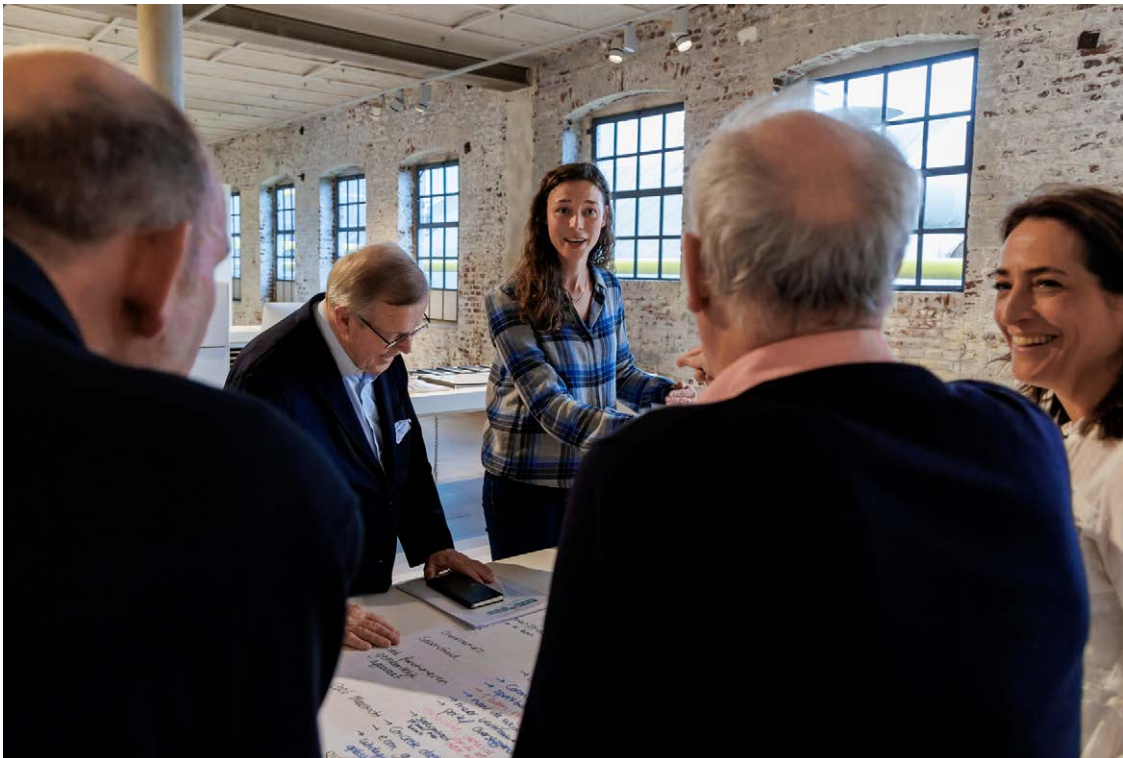
partners in gesprek over de bouwstenen voor 2022 - 2026, dinsdag 12 april

behoefte. Veel partijen hebben aangeven hier voor open te staan. Ons advies is om in de formatiefase concrete afspraken te maken over hoe dit te operationaliseren en levend te houden.